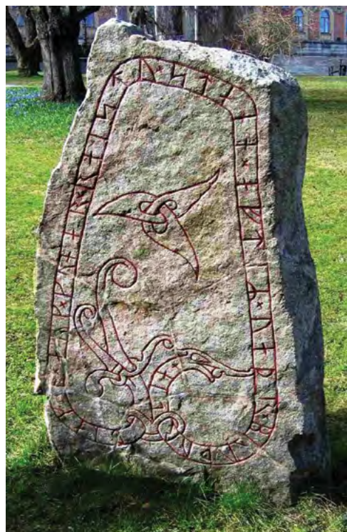
Рунический камень из Фунбо. Швеция, эпоха викингов.

Изображения этого символа присутствуют как на предметах очевидно сакральных (например, на нескольких скандинавских подвесках в виде Молота Тора), так и на предметах сугубо бытовых (примеры – седло из Йорка эпохи викингов или уже упомянутые монеты Харальда III). При этом форма символа может существенно меняться – с сохранением структуры исходного узла. Так, например, символ трикветры , изображенный на руническом камне их Фунбо (Уппланд, Швеция, также эпоха викингов), на первый взгляд мало напоминает «классический» вариант этого знака, – и все же является им.