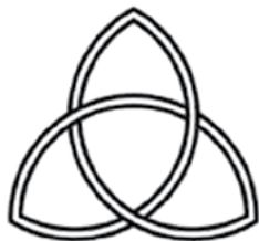
Стандартизированный вариант трикветры.

Еще один древний сакральный символ, восходящий к «невозможному узлу», это тройная петля, называемая иногда трикветра (лат. triquetra , от корней со значениями «три» и «угол», «конец»).