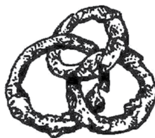
Балто-славянский амулет в виде трех сплетенных (связанных «узлом») металлических колец. В основе примененной здесь «магической технологии» лежит та же идея, что и в представлении о магии завязывания узлов. Рубеж н.э.

Относительно поздним «расширением» подобных волшебных технологий является перенесение магии завязывания с реальных узлов на их графические изображения; вероятно, именно так появились сакральные символы, о которых пойдет речь в данной статье. Развитие сакральной графики этого типа привело, в конечном счете, и к возникновению сложных плетеных орнаментов, столь хорошо известных нам в прикладном (а позднее – и в изобразительном) искусстве скандинавов и кельтов.