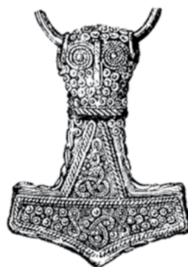
Амулет в виде Молота Тора с двумя изображениями символа трикветры. Позолоченное серебро. Эланд, Швеция, эпоха викингов.

На Северо-Западе, насколько мы можем судить, наибольшее распространение трикветра получила в эпоху викингов, – хотя сам по себе этот символ гораздо древнее. Артефакты с его изображением встречаются по всей «Ойкумене викингов»: от серебряных монет Харальда Сигурдссона Сурового (короля Норвегии в 1046—1066 гг.) до находок в курганах центральной России (костяной скандинавский гребень с изображением трикветры из раскопок под Суздалем, датированный XI веком).