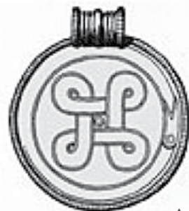
Брактеат из Люнгбю.