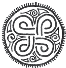
Прорисовка элемента орнаментального украшения памятного камня из Хаблингбо Хавор. Готланд, V-VI вв.

Одним из простейших древних магических узлов является распространенный практически по всему Северо-Западу квадратный узел с четырьмя петлями, в поздних описаниях называемый иногда «знаком св. Иоанна». Древнейшее его изображение мы встречаем на готландском памятном камне из Хаблингбо Хавор (V-VI века); лишь немногим более поздним временем датируется скандинавский брактеат из Люнгбю, где этот знак присутствует как основной магический символ.